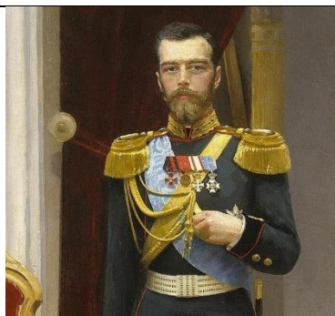
Этюд к картине