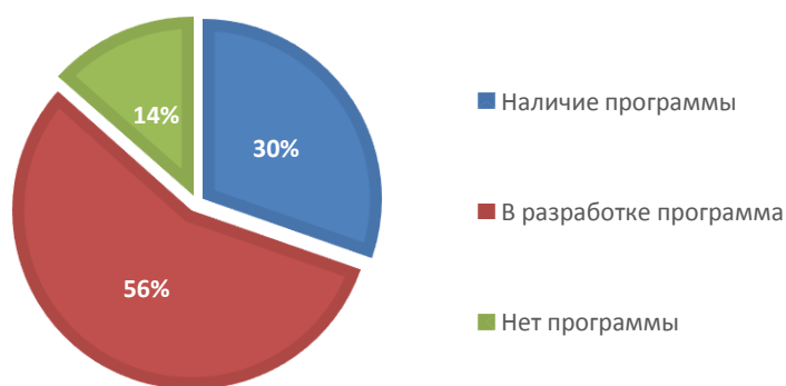
ПРОГРАММЫ ПРОФОРИЕНТАЦИИ В ОО Г. КРАСНОЯРСКА

В большинстве имеющихся программ указаны конкретные цели и задачи по направлению деятельности, имеются планы мероприятий на год и более. Деятельность запланирована циклично и последовательно, программы содержат методические разработки и иную вспомогательную информацию для организации работы.