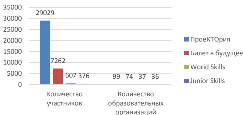
Участие обучающихся в профориентационных мероприятиях за 2020-2021гг.

376 обучающихся из 36 общеобразовательных организаций приняли участие в Чемпионате профессионального мастерства «Junior Skills».